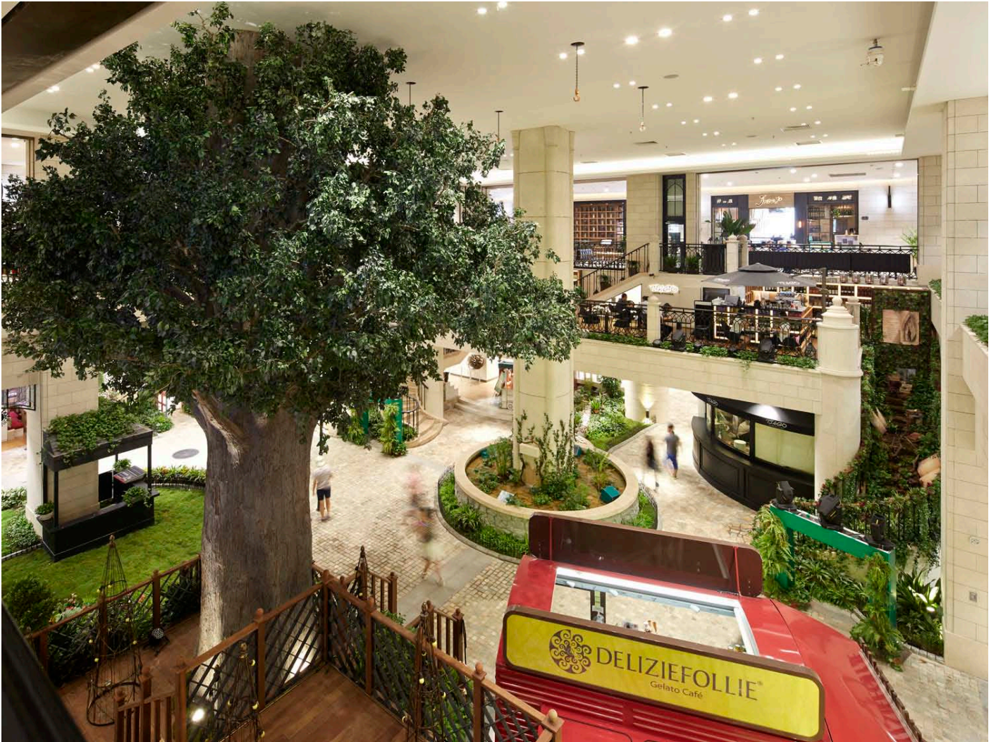
View of the atrium and interior environment. 吹き抜けのあるアトリウム

The overall design of 'a natural and realistic town' is consistent through the space. Each individual tenant had to follow strict regulations for the store facades. A fountain at the center of the 5th floor encourages the customers to spend a pleasant time inside the shopping center. The lighting follows the passage of time changing during the day to recreate a realistic atmosphere. This innovative design offers a unique experience to the customers, that can take a leisurely stroll in an European environment at the center of Beijing.